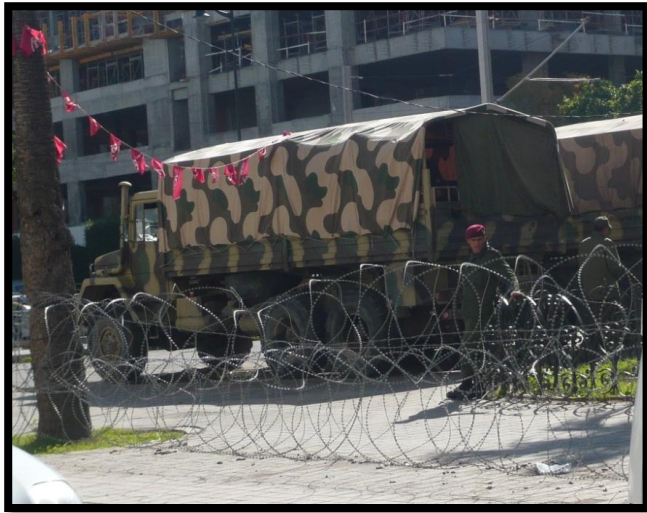
Militær og pigtråd på Avenue Habib Bourguiba i Tunis by, og fine tunesiske keramikkakler