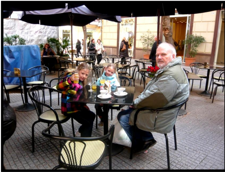
På fortovs-café i Palermo