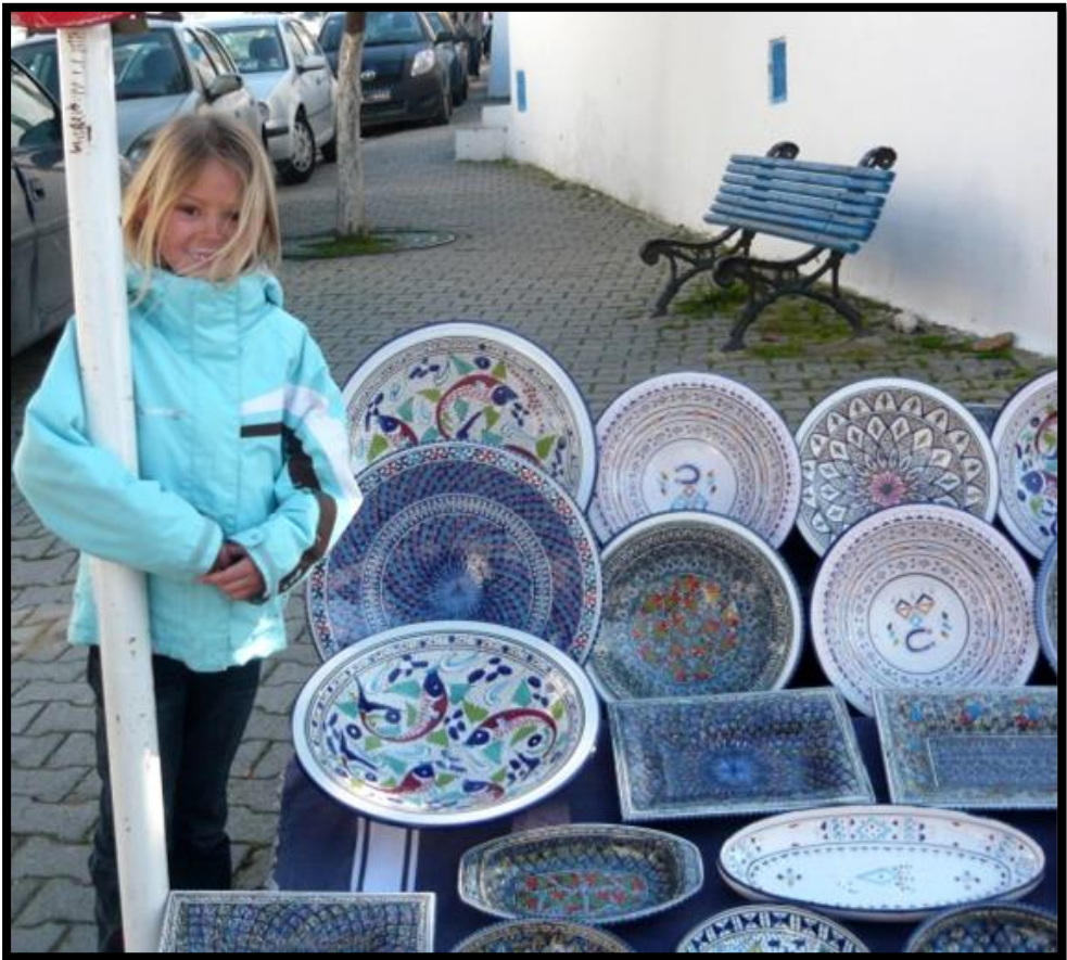
Moana i kunstnerbyen Sidi Bou Said, hvor de solgte flot keramik. Her var appelsintræer.