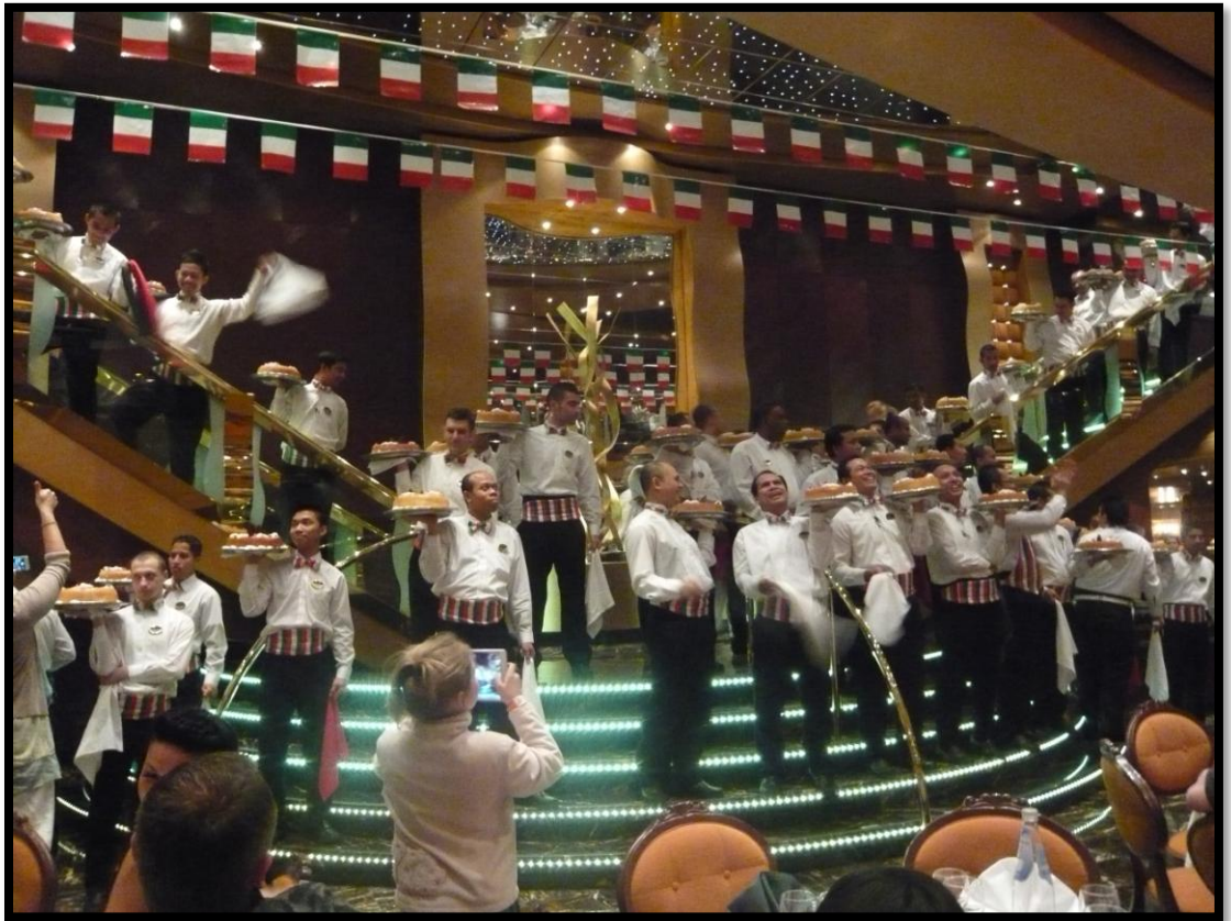
Italian Night i Restaurant "Il Reglio"