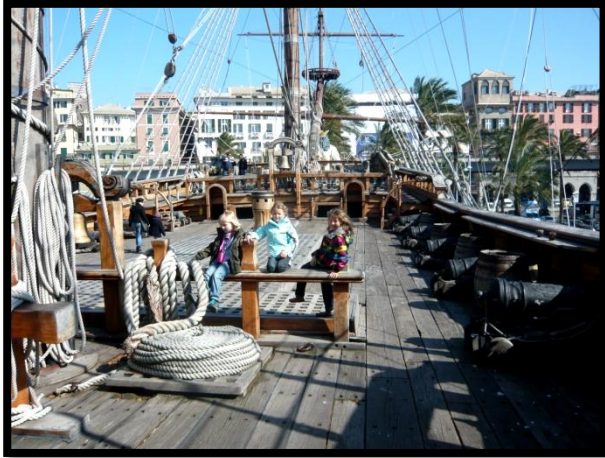
Sørøverskibet i Genoa