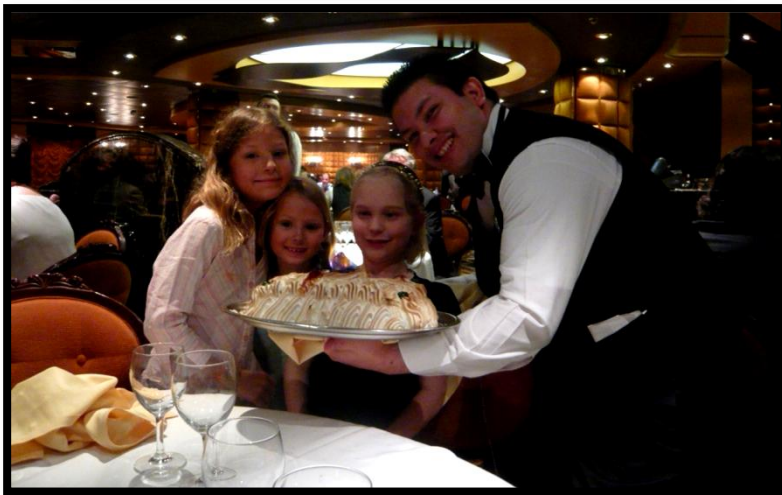
Fin frokostbuffet på MSC Splendia og isdessert fra galla-aften – tjeneren var fra Honduras.