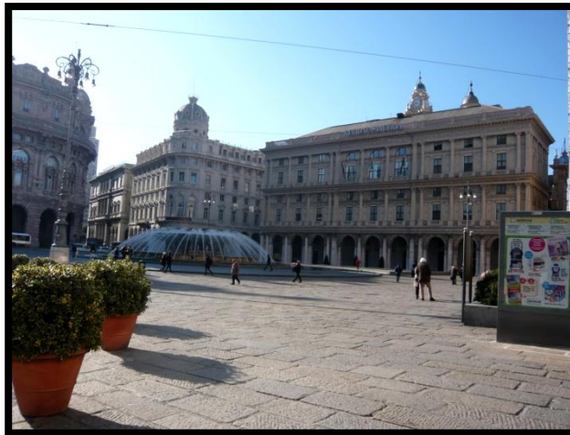
Piazza de Ferrari i Genoa med Palazzo Ducati