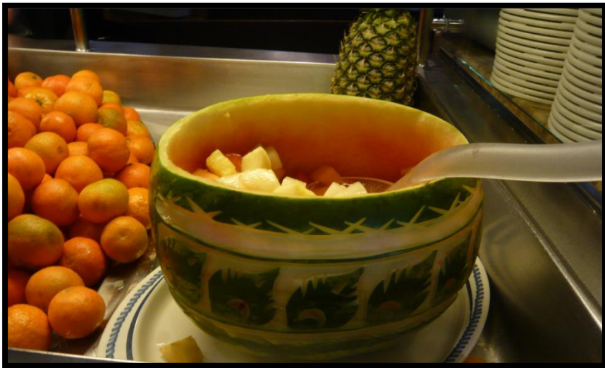
Fin frugtserving på MSC Splendida – frugtsalat i udhulet vandmelon