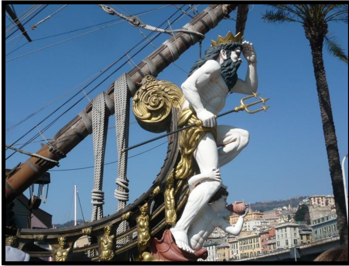
Sørøverskibet i Genoa og MSC Splendia