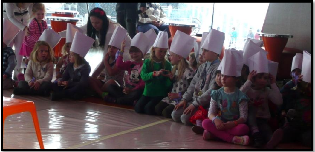
Undervisning i at lave pizza.