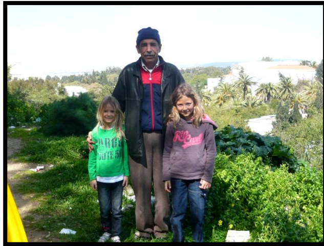
Den flinke taxichauffør i Tunis