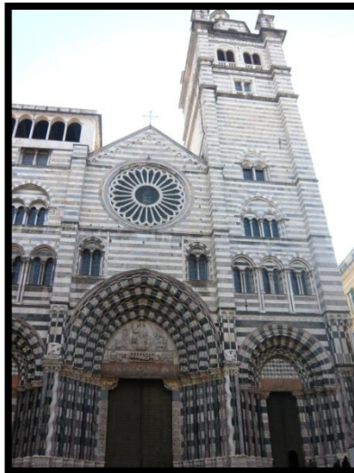
Fra en fiskehandler i Genoa og San Lorenzo-kirken med Johannes Døberen relikvier